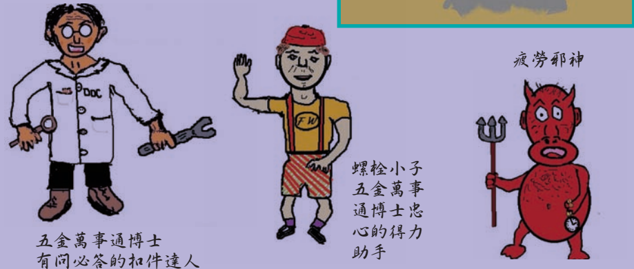
五金萬事通博士 有問必答的扣件達人