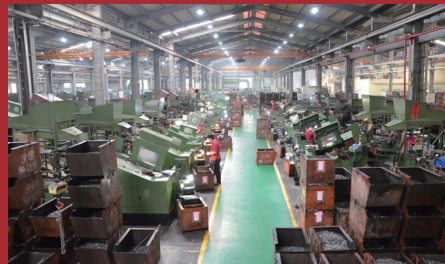
圖3.4.5. 井然有序的工作環境，廠內擁有40套生產設備、2套熱處理設備。