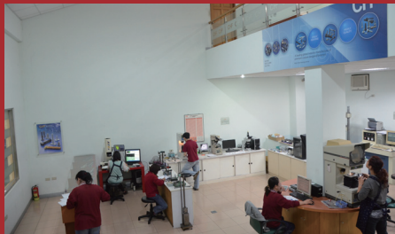
圖2. 百分百使用率的品質系統實驗室，近期引進自動檢測設備加入品質捍衛陣容。