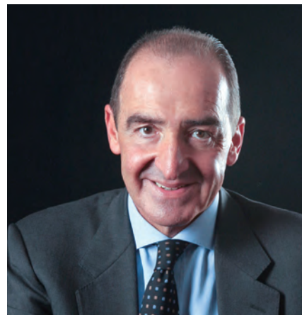
的競爭力。義大利市場也已經受到這些改變的影響。

扣件是許多產品組裝所需要的必需品，就如同麵包、米食及其他每日餵養千千萬萬人口的产品一樣。全球市場、競爭和競爭能力已使扣件生產和批發廠商的結構產生非常重大的改變，並使其表現、產品和服務都有明顯改善。當有公平競爭時就能驅使人們發揮與生俱來