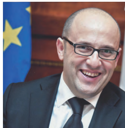
資在地化並時時刻刻準備成長，也就是「具全球視野的在地化成長」。

因此對於接下來的2016年，我預期幾乎可以看到所有會員朋友和義大利扣件廠商的營收都會出現成長。我建議業界朋友應該試著去建立更多交流管道，盡可能地以正面的態度並趕上這個在五年內可能會出現不同市場定位的高速變化。因此我想要以一句話替2016的發展做為此文章的結尾：與世界共享、投