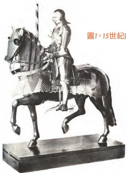
圖1、15世紀的武裝騎兵

但讓英國擔心到極點的原因，是來自義大利北邊的騎兵穿上了當時新高科技的鎧甲，這種設計和產製讓義大利騎兵的鎧甲無法被英國當時的主要武器（錐尖頭的長弓箭）刺穿。這些好比現代導彈且令人懼怕的弓箭從1千名受訓弓箭手的手中，以每10秒鐘一支的速度射出去，在進攻的騎手攻下彼此敵對陣營之間一半的距離之前，就能佈滿遮暗整個天空。