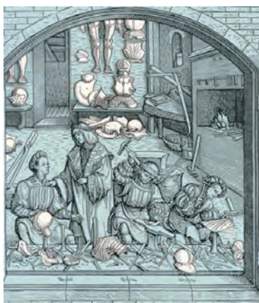
1525年漢斯·布格馬爾的木雕

或許，中世紀盔甲這種扣件科技最令人驚豔的發展，就是滑動式鉚接件。如圖三所示的這些物件讓上臂、手肘和下半身的關節得以活動。這些可移動的金屬片在當時稱為「lame」，是一種交疊的金屬片，讓穿戴者的上臂和手肘在無阻礙的狀態下可以往三個角度做肢體動作，這些金屬片彼此緊緊的鎖固在一起，以避免被刀劍穿透。再加上這些金屬片能覆蓋住手掌和手指，在下馬戰鬥的時候能為關節自由活動的腳部提供保護。中世紀工匠的技術成就顯而易見且具備意義。