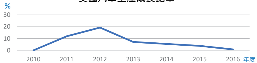
美國汽車生產成長比率

美國是全球第二大汽車製造國，2016年佔了全球汽車生產的12.8%，但統計顯示美國汽車產業的成長趨勢已經趨緩。