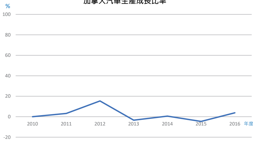
加拿大汽車生產成長比率