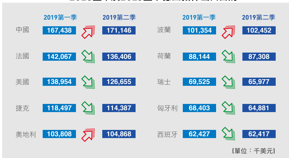
2018上半及2019上半德國扣件出口目的

在進口量部分，台灣是德國市場的主要扣件供應來源。在2018年，台灣出口約186,766噸扣件至德國。在2019年上半，台灣扣件供應商輸出超過85,000噸扣件，稍微低於其在2018年上半的出口。相較於其他出口至德國的國家，前三大出口國(台灣、義大利和中國)彼此之間有很大的差距。在2019年前兩季，這三國共輸出22.2萬噸以上扣件至德國，大約佔德國扣件進口總量的45%。